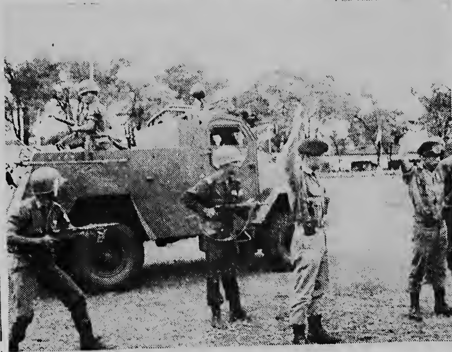
Nos ta hanja aqui un idea dje ehercicio militar teni pa miembronan di milicia local. Esaqui ta alavez un portret pa muntra cu nan ta fuerte.